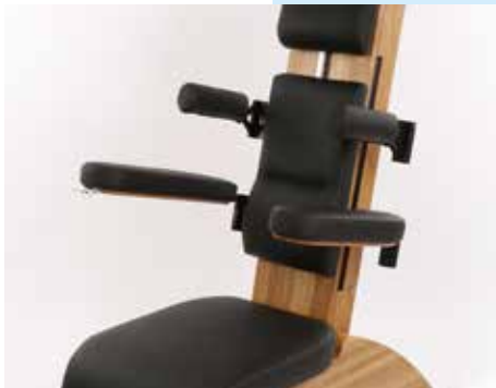
Einblicke ins Engineering: Der „grow“-Entlastungsstuhl entsteht