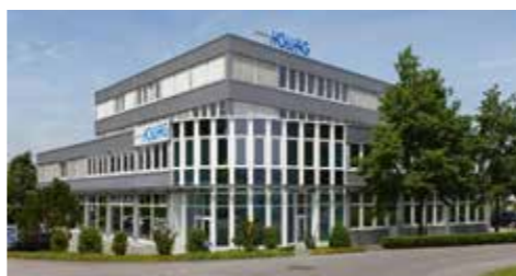
Unser Hauptproduktionsstandort in Dintikon

Weitere Produktionsstandorte im Ausland: