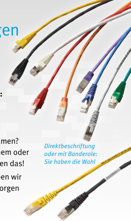
Direktbeschriftung oder mit Banderole: Sie haben die Wahl