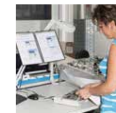
Die Qualität muss stimmen: Wir prüfen es

Sie haben hohe Anforderungen an unsere Produkte? Wir haben die passenden Prüfmöglichkeiten für Kabel. Gern führen wir kundenspezifische Prüfungen durch, komplett mit individuellem Prüfprotokoll. Dazu gehören elektrische Messungen, Biegeprüfungen mit Zugmaschine, Zug- und Alterungsprüfungen, Deformations- und Wärmedrucktests. Ist es nicht schön, zu wissen, dass Ihr Partner die gleichen Qualitätsstandards einhält wie Sie selbst? _